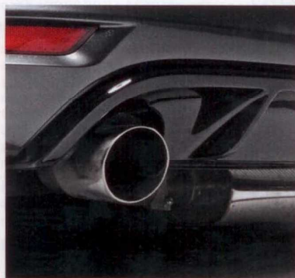
Grollender Sound ist das Markenzeichen der Edelstahl-Abgasanlage zu 1099 Euro

Doch Leistung kann ein GTI wohl nie genug haben. Weshalb sich der in Koblenz ansässige Tuner Wetterauer – seit über 15 Jahren auf elektronische Leistungssteigerungen spezialisiert – den Vierzylinder einmal genauer angeschaut hat. Herausgekommen ist, ganz nach Art des Hauses, ein Software-Tuning, das gegen günstige 1028 Euro samt TÜV-Abnahme 50 PS mehr unter die GTI-Haube zaubert. 260 PS stehen also zur Bewertung, dazu als Neben-